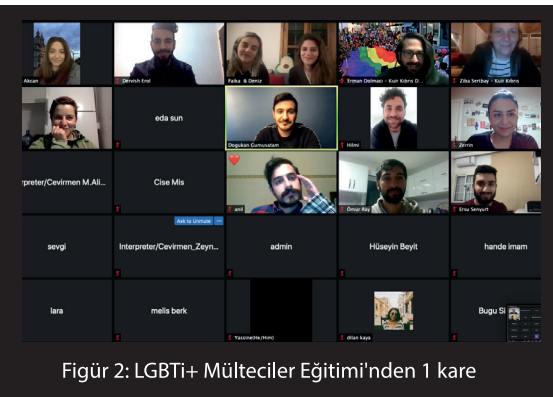
Figür 2: LGBTİ+ Mülteciler Eğitimi'nden 1 kare

Çalıştay ise 22 Mart 2021, Pazartesi tarihlerinde çevrimiçi olarak gerçekleşti. Eğitim ve atölye Sosyal Hizmet Uzmanı Güney Tosun tarafından verildi. 20 Şubat'ta gerçekleşen eğitimde, Kıbrıs'ın kuzey kesimindeki sosyal hizmetlerin genel durum analizi ve SWOT analiz çalışması gerçekleştirildi. Ayrıca, Kuir Kıbrıs Derneği'nin sosyal hizmetlere bakış açısının belirlenmesi adına hedef kitle oluşturma, iletişim çözümleri ve stratejik çözümler üzerinde bilgi aktarımları yapılarak, kriz ve vaka yönetimi üzerine grup çalışmaları yapıldı. Ardından 22 Mart'ta gerçekleşen atölye çalışması ile eylem planı üzerine yoğunlaşıldı. Atölye çalışması, Kuir Kıbrıs Derneği için sosyal hizmet bacağına güçlendirilmesi ve yol haritası belirlenmesi için önemli bir adım olmuştur.