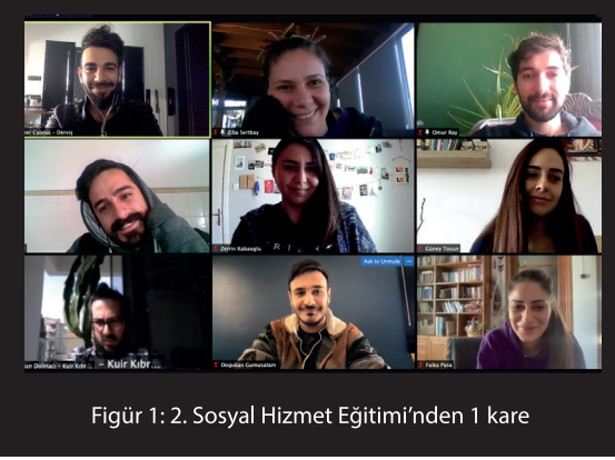
Figür 1: 2. Sosyal Hizmet Eğitimi'nden 1 kare

Avrupa Birliği tarafından finanse edilen ve Kuir Kıbrıs Derneği tarafından KAOS GL işbirliğiyle yürütülen "Sömürden Özgür LGBTİ+ HAYAT" Projesi kapsamında, Kuir Kıbrıs üyelerine ve dayanışma hattı gönüllülerine yönelik İkinci Sosyal Hizmet Eğitimi ve Çalıştayı düzenlendi. Eğitim, 20 Şubat 2021 Cumartesi,