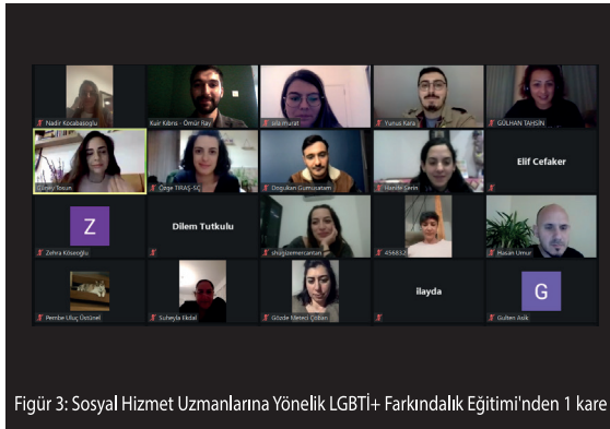
Figür 3: Sosyal Hizmet Uzmanlarına Yönelik LGBTİ+ Farkındalık Eğitimi’nden 1 kare

Bu araştırma, toplumsal cinsiyet farkındalığının yükseltilmesi, sosyal hizmete erişimde LGBTİ+’ların hizmetlere erişiminin güçlendirilmesi için geliştirilecek politikaların belirlenmesi açısından büyük önem taşımaktadır. Araştırmaya katılım tamamen gönüllülük esaslıdır ve araştırma etik kurallar çerçevesinde ilerlemektedir. Ortalama 6-9 dakika sürecek olan araştırma anketine, Kuir Kıbrıs Derneği’nin sosyal medya hesapları ve websitesi üzerinden ulaşabilirsiniz.